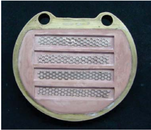
Figura 3. Se aprecian los insertos metálicos en la zona des-encerrada o donde ocupó el espacio el patrón de cera listo para ser encapsulado en el acrílico.