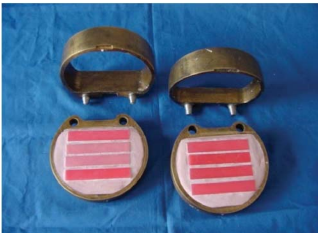
Figura 1. En la imagen se aprecian los patrones de cera en la mufla para las muestras con las dimensiones antes citadas.

Se realizó un estudio experimental formado por cuatro grupos con diez muestras cada uno, integrando 40 especímenes en total. El grupo «A» fue de acrílico Lucitone 199 ( Dentsply International Milford Delaware ) sin inserto metálico, el grupo «B» de acrílico Lucitone 199 con inserto metálico ( Dentaurum, Pforzheim, Germany ), el grupo «C» de acrílico ProBase Hot ( Ivoclar Schaan Liechtenstein ) sin inserto metálico y el grupo «D» de acrílico ProBase Hot con inserto metálico. Todas las muestras tuvieron las siguientes dimensiones: 10 mm de ancho por 65 mm de largo por 2.5 mm de grosor, cumpliendo el punto 4.3.5 de la especificación no. 12 de la ADA 10 para polímeros de bases de dentadura.