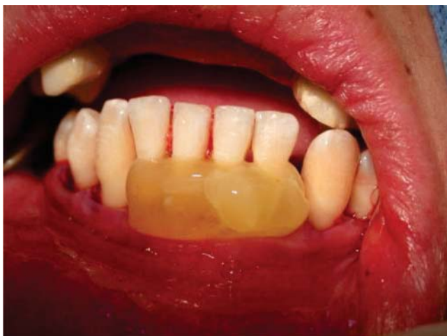
Figura 4. Aplicación del PRFC en los dientes inferiores.

guiente cirugía se realizó desbridamiento por colgajo en los dientes inferiores (35, 34, 33, 32, 31, 41, 42, 43, 44, 45), con colocación de PRFC y autoinjerto; se suturó con puntos aislados con vicryl 4-0 ( Figura 4 ).