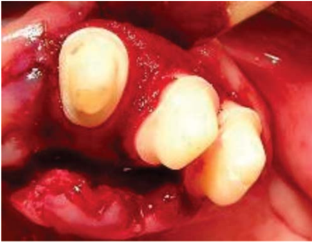
Figura 5. Colocación de la membrana y autoinjerto en el diente 23, 24 y 25.