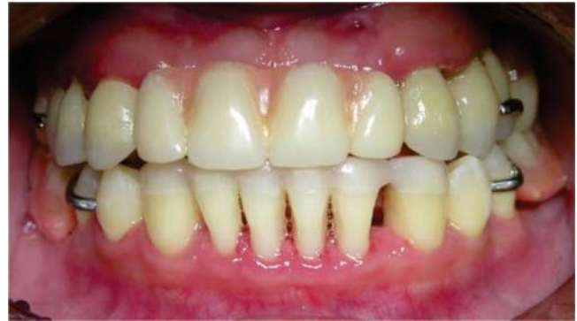
Figura 6. Foto ocho meses después del tratamiento con la rehabilitación protésica.

En este caso clínico fue conveniente el uso de antibióticos porque no existió una respuesta favorable únicamente con el tratamiento periodontal convencional.