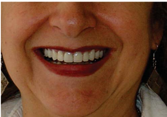
Figura 6. Análisis comparativo extraoral. Al inicio del tratamiento se apreciaba sonrisa baja y al terminarlo sonrisa media que es más estética.

como a la respuesta de cicatrización individual. Mencionan que varios autores en relación a la cantidad de tejido a eliminar, han sugerido remoción quirúrgica de soporte periodontal de 3 mm (Ingber 1977), 2.5 a 3.5 mm (Palomo 1978), 4 mm (Rosenberg 1980).