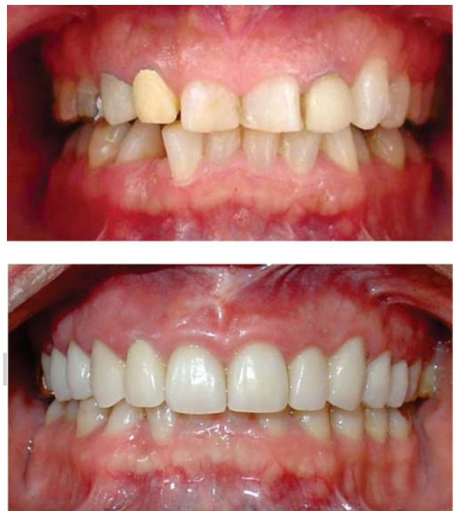
Figura 5. Análisis comparativo intraoral. Al inicio del tratamiento y a los 22 meses, obteniendo una adecuada unidad protésico periodontal.

A los 22 meses el margen gingival permaneció estable, manteniendo una adecuada unidad protésico periodontal ( Figura 5 ).