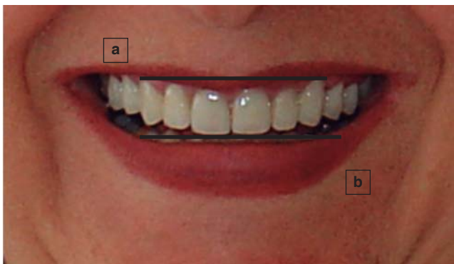
Figura 1. Análisis de la sonrisa. Sonrisa media que muestra la longitud total cérvico incisal de dientes anteriores y zona de papilas. a) línea gingival, b) plano incisal.

Para determinar el tipo de intervención quirúrgica ( Cuadro I ), Coslet y colaboradores 5 clasifican la sonrisa gingival en función de la relación establecida entre encía, corona anatómica, unión cemento-esmalte (UCE) y cresta alveolar (CA), determinando: