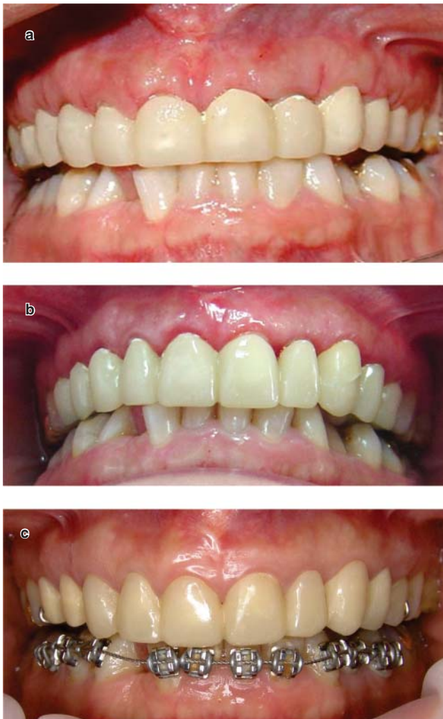
Figura 4. Fases de cicatrización, se retiraron suturas a los 12 días. a) a los 15 días se ajustan provisionales, b) a las seis semanas con provisionales de resina bisacrílica, c) a los diez meses con provisionales finales.

Las restauraciones finales libres de metal se cementaron a los catorce meses de cicatrización, observando tejidos firmes y estéticos.