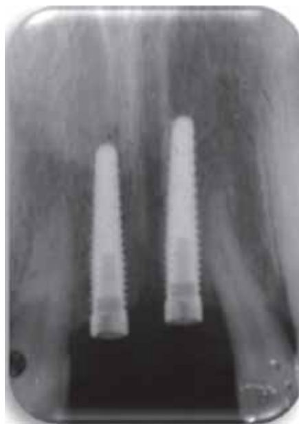
Figura 5. Radiografía dentoalveolar de control tras la colocación de los implantes.