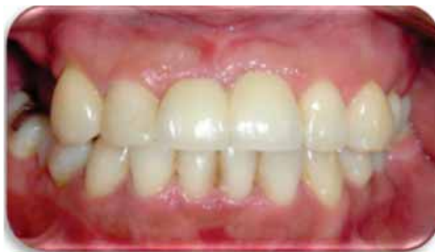
Figura 7. Dos semanas de cicatrización.

A la semana de control postoperatorio tras la colocación de los implantes ( Figura 6 ), se realizó el retiro