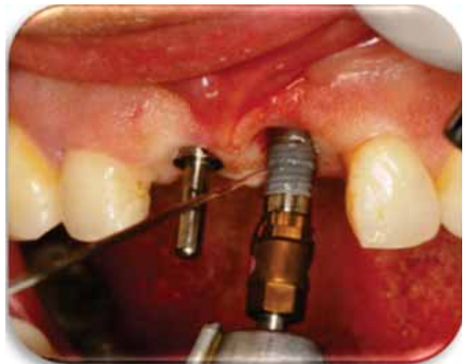
Figura 4. Colocación de los implantes Nobel Replace® Ti U de 3.5 x 13 mm.

probó el paralelismo ( Figura 3 ) y se colocaron los implantes Nobel Replace® Tapered TiU NP de 3.5 x 13 mm a 3 mm por debajo de la unión cemento esmalte de los dientes adyacentes en ambos sitios a una velocidad de 30 Ncm hasta obtener la longitud deseada ( Figura 4 ).