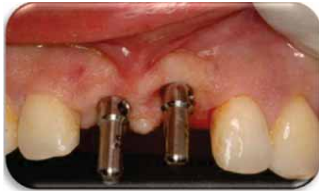
Figura 3. Paralelismo en ambos sitios.

de prevenir una mayor pérdida de tejido, debido a que es una zona altamente estética. Se ajustó la guía quirúrgica ( Figura 2 ) para verificar si la posición mesiodistal y vestibulo-palatina de los implantes era la correcta; posteriormente se realizó el fresado quirúrgico con la fresa inicial a 900 rpm hasta una longitud de 13 mm en ambos sitios. Se com-