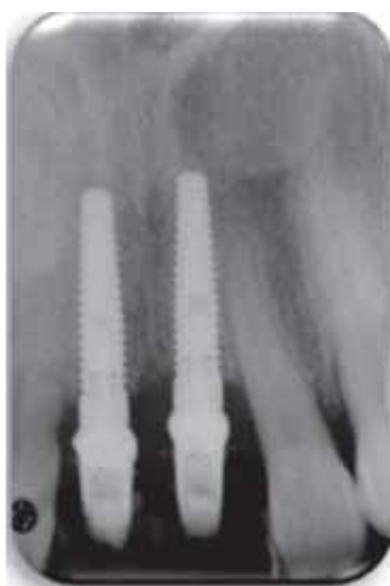
Figura 8. Tres meses postcolocación.