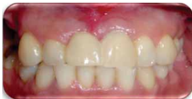
Figura 6. Una semana de cicatrización. Se puede observar una arquitectura gingival aceptable.