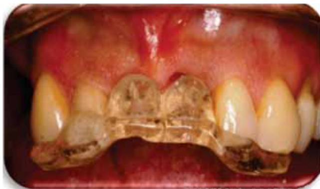
Figura 2. Colocación de la guía quirúrgica.

de prevenir una mayor pérdida de tejido, debido a que es una zona altamente estética. Se ajustó la guía quirúrgica ( Figura 2 ) para verificar si la posición mesiodistal y vestibulo-palatina de los implantes era la correcta; posteriormente se realizó el fresado quirúrgico con la fresa inicial a 900 rpm hasta una longitud de 13 mm en ambos sitios. Se com-