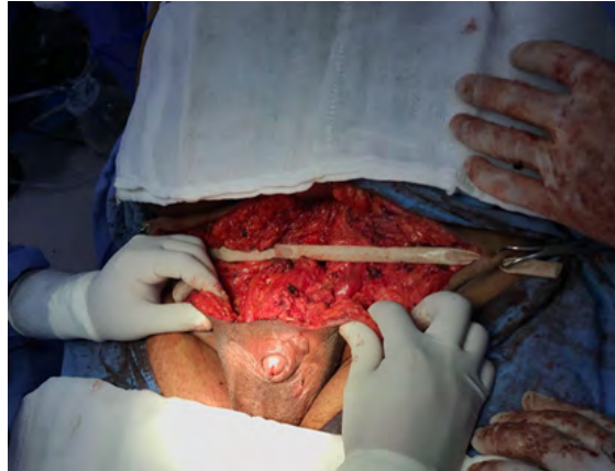
Figura 12. Caso 2, producto de dermolipectomía