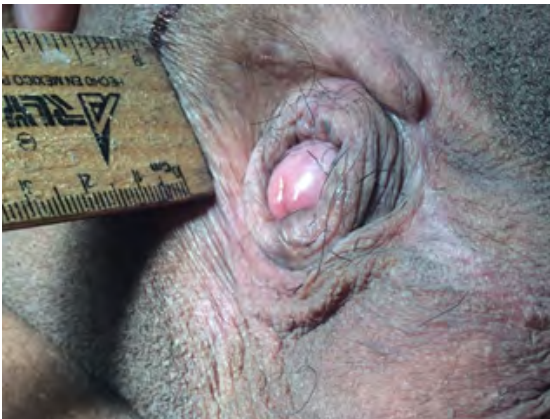
Figura 10. Caso 2, pene inconspicuo con una orientación a la derecha por el tejido cicatrizal