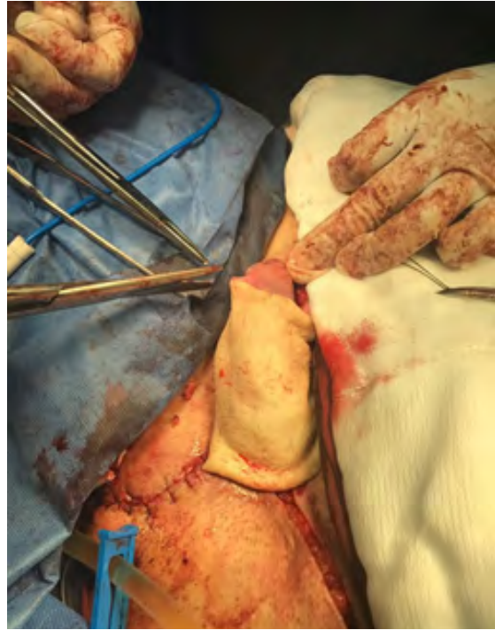
Figura 7. Caso 1, colocación del injerto de piel de manera cilíndrica en pene