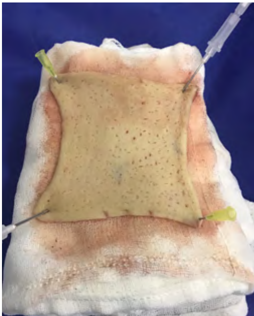
Figura 6. Caso 1, injerto de piel fenestrado extraído de muslo del paciente, en el que se retiró el exceso de tejido adiposo