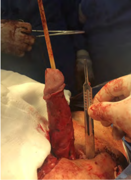
Figura 5. Caso 1, fotografía lateral del pene sin piel liberado del tejido fibroso