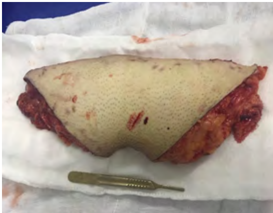
Figura 2. Caso 1, producto de dermolipectomía en pubis respetando el borde del pene