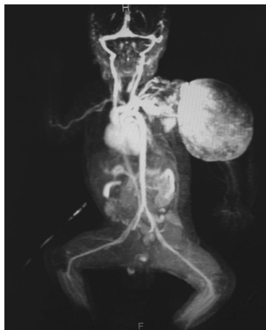
Figura 2: Angiorresonancia con lesión vascular que afecta 80% de la extremidad superior izquierda, se extiende a tórax pasando la línea media.

kaposiforme con fenómeno de Kasabach-Merritt, solicitando resonancia magnética (IRM). Se pidió valoración a cirugía pediátrica y angiología; sin embargo, no fue candidato para manejo local de resección o embolización por extensión de la lesión.