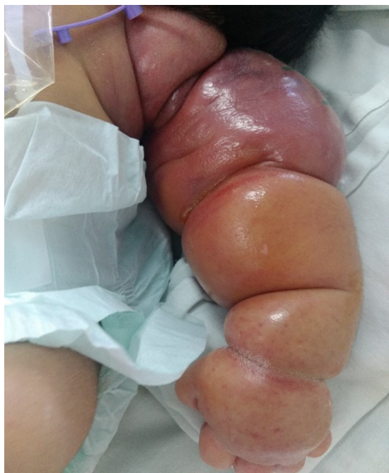
Figura 1: Lesión en extremidad superior izquierda a su ingreso.

Fue valorado al segundo día de vida por ortopedia, quienes solicitaron estudio de imagen simple y contrastada. Hematología pediátrica, por los datos clínicos y por laboratorio sospechan de hemangioendotelioma