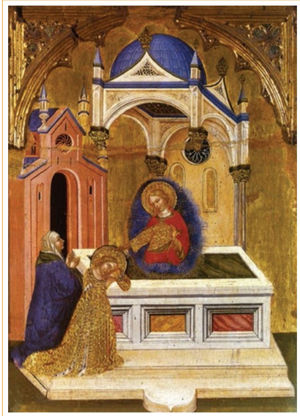
Figura 1. Santa Lucía ante la tumba de Santa Águeda. Autor: Jacobello Del Fiore. Museo Cívico, Fermo, Italia.

Para conducirla al prostíbulo, los soldados le amarraron las manos y los pies con cuerdas, pero por más esfuerzos que hacían no podían moverla. La leyenda indica que, mientras ella discutía con el cónsul, el Espíritu Santo la tornó tan pesada que ni siquiera varios bueyes consiguieron moverla. Al enterarse de lo sucedido, el cónsul ordenó someterla a suplicio con aceite hirviendo, pero no logró hacerla desistir. A menudo, esta escena se representa en pinturas como