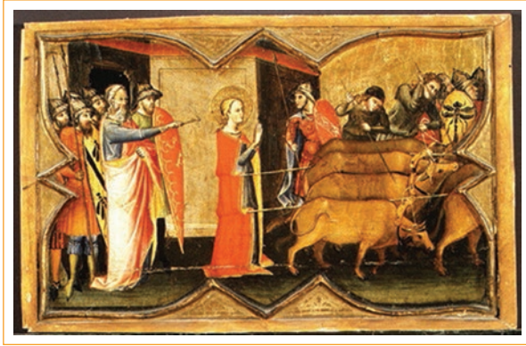
Figura 2. Santa Lucía resistiendo los esfuerzos para moverla. Autor: Giovanni di Bartolommeo Cristiani. Museo Metropolitano de Arte. Nueva York, EE. UU.