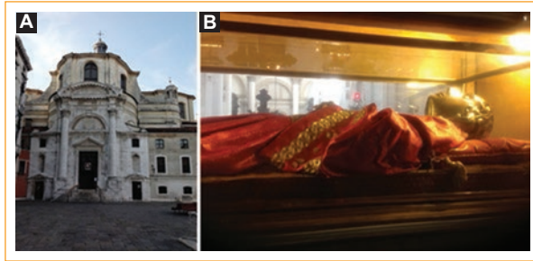
Figura 5. A: Fachada del templo de los santos Jeremías y Lucía en Venecia. B: Máscara de plata de Santa Lucía.

(1881-1963) (futuro Juan XXIII, «El buen papa Juan»), el rostro de la santa fue cubierto con una máscara de plata (Figs. 5 A y B). Los restos de la santa fueron trasladados a esta iglesia en 1861, cuando la originalmente dedicada a ella fue demolida para construir la estación de tren, que lleva por ello su mismo nombre: Stazione di Venezia Santa Lucia . Como Lucía era siciliana, hubo muchas presiones para que la santa fuera devuelta a su lugar de nacimiento, y los sicilianos se han tenido que conformar con un dedo de ella que se venera en su iglesia de Santa Lucía en Siracusa. Cuentan que un devoto siciliano llegó a Venecia y pidió permiso para besar el cuerpo de la santa y en vez de darle un beso le dio una mordida al dedo y se lo llevó escondido dentro de la boca 1,2 . Se rumorea que fue la mafia siciliana quien, el domingo 8 de febrero de 1981 a las 9 de la noche, robó el cuerpo de Santa Lucía de la iglesia de San Jeremías, de Venecia. Al salir corriendo, los bandidos dejaron parte del botín: la cabeza de la santa, un dedo y la máscara de plata que le cubría el rostro. El cuerpo fue recuperado y devuelto a la Iglesia unos meses después 5 .