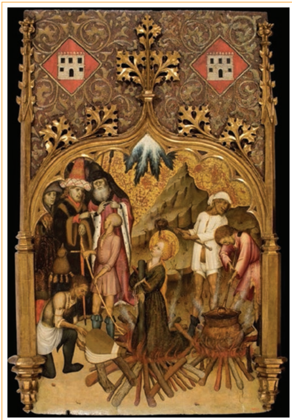
Figura 3. Martirio de Santa Lucía en la hoguera. Autor: Bernat Martorell.

hermosos que los que tenía antes 4 . Dicen, también, que le atravesaron la garganta con una lanza. Finalmente Lucía fue sepultada en el mismo lugar