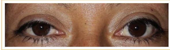
Figura 1. Exploración en condiciones de luz con apertura de párpado. Ojo derecho: 9 mm, distancia margen reflejo 1 (DMR 1): 2 mm. DMR 2: 7 mm. Ojo izquierdo apertura: 12 mm. DMR 1: 4 mm. DMR 2: 8 mm. Anisocoria.