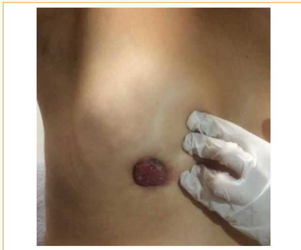
Figura 3. Tumoración de mama derecha.

que se presentan como síndrome de Horner 3 . A diferencia de nuestro caso, la paciente no contaba con diagnóstico de malignidad previamente.