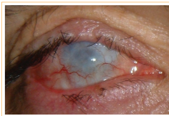
Figura 1. Muestra la condición en la cual quedó el ojo derecho del paciente.

La MOOKP es un tipo de cirugía oftalmológica que permite recuperar la visión de un ojo ciego cuando los trasplantes de córnea han fallado, o cuando el trasplante de córnea no puede practicarse. La técnica quirúrgica de la MOOKP corresponde a un trasplante autólogo, en el cual se utiliza una lámina osteodental, extraída del maxilar superior, como soporte biológico para un cilindro de polimetilmetacrilato (PMMA), previamente calculado mediante ecografía, por ende específico para cada paciente,