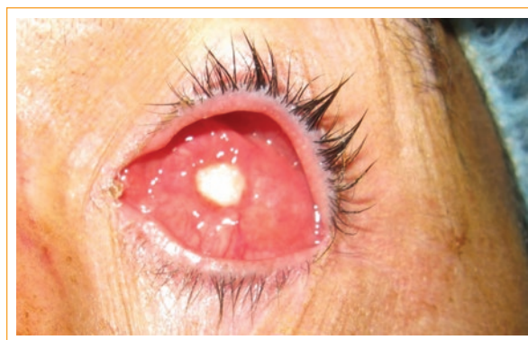
Figura 2. Exposición del implante un año después de la reconstrucción de la cavidad orbitaria con injerto de pericráneo.

utilizamos un implante dermograso de glúteo que se colocó sobre un implante orbitario de PP de 20 mm con inyección de ceftazidima subconjuntival 100 mg/0.5 ml e inyección en tejidos de colirio reforzado de ceftazidima 50 mg/ml. Tras tres años de seguimiento está asintomático, con buen resultado funcional y buena adaptación a la prótesis externa.