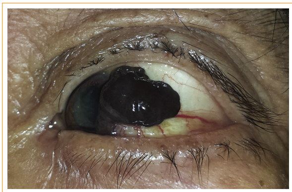
Figura 1. Vista de frente. Se aprecia lesión nodular pigmentada, con bordes regulares y vasos nutricios dilatados en la conjuntiva bulbar.

Protección de personas y animales. Los autores declaran que para esta investigación no se han realizado experimentos en seres humanos ni en animales.