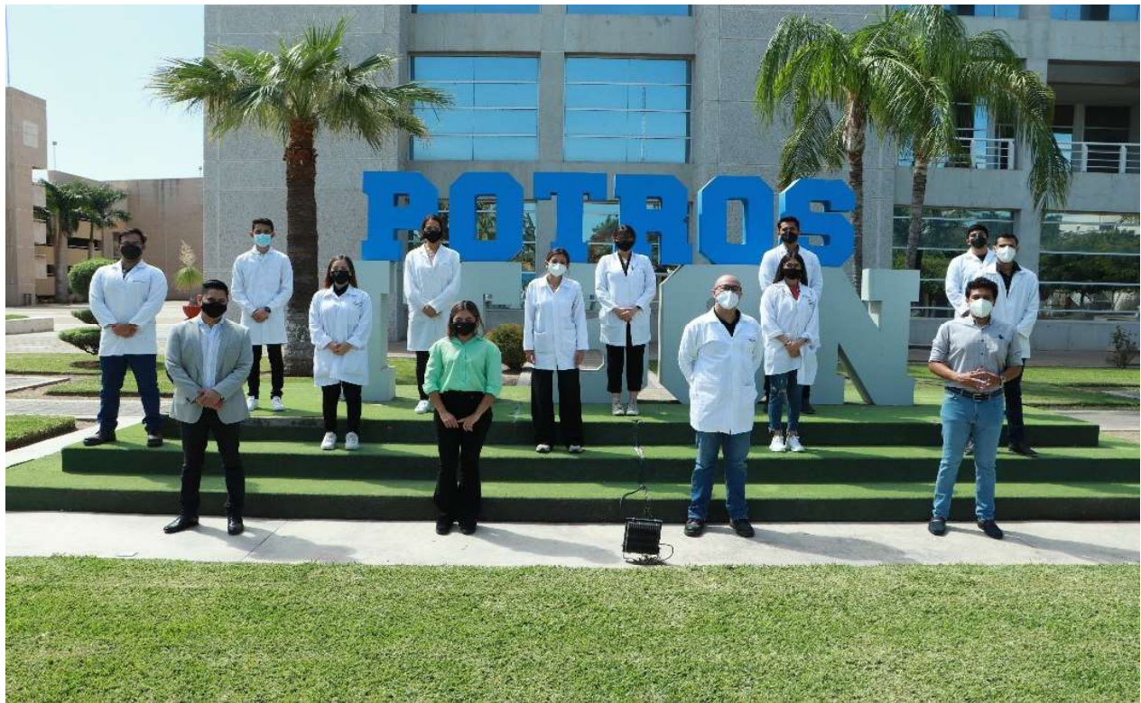
Figure 3. Work team of the LBRM-COLMENA Research Node, Sonora, Mexico. Figura 3. Equipo de trabajo del Nodo de Investigación LBRM-COLMENA, Sonora, México.

ron a través de los seminarios vía remota. De esta manera, se reforzaron las colaboraciones con otros equipos de trabajo de diferentes instituciones y países, logrando fortalecer y formar más redes de investigación, y obtener una mejor retroalimentación de los resultados de los proyectos. En este sentido, a pesar de la suspensión de estancias y congresos académicos, se logró generar y atender capacitaciones, talleres y congresos que se trasladaron a plataformas virtuales, lo cual permitió su difusión a un mayor número de participantes y que el material estuviera disponible electrónicamente. Sólo por mencionar un ejemplo, durante cada verano, el LBRM-COLMENA abre sus puertas a estudiantes de diferentes estados y países para realizar estancias científicas (Figura 3). A pesar de las complicaciones por la pandemia, se aceptaron estudiantes este verano 2020 para entrar al laboratorio en