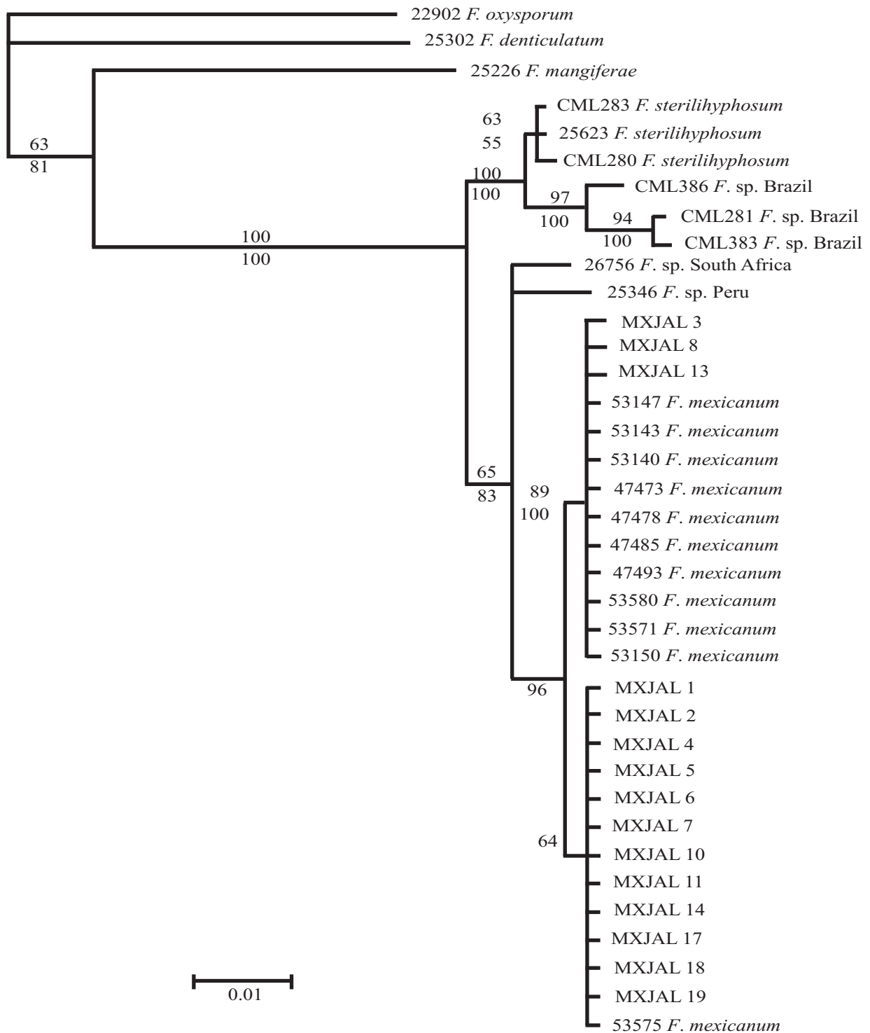
Figura 2. Árbol de consenso estricto a partir de 46 árboles más parsimoniosos (índice de consistencia de 90 e índice de retención de 95) obtenidos del análisis de la matriz combinada de secuencias de EF-1 \alpha y \beta -tubulina. Agrupamientos con apoyo estadístico se indican sobre el brazo el valor bootstrap y por debajo la probabilidad posterior. La longitud de ramas representan el promedio de las tasas de sustitución en cada rama de los árboles con mayor probabilidad posterior.