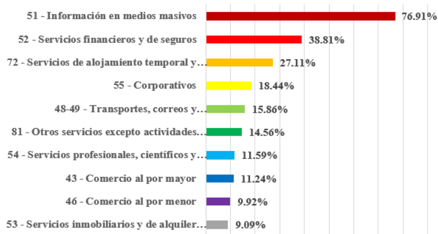
Gráfico 4. Sectores con mayor crecimiento acumulado en el Estado de Durango (2014-2018)

Fuente: Elaboración propia con datos del Banco de Información Económica de INEGI