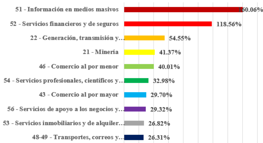
Gráfico 1. Sectores con mayor crecimiento acumulado en el Estado de Durango (2003-2014)

Fuente: Elaboración propia con datos del Banco de Información Económica de INEGI