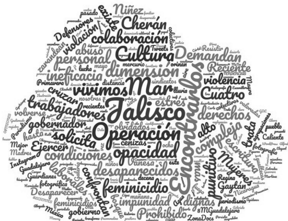
Gráfico 3 Nube de palabras: ZonaDocs

que conforman los textos de Tráfico ZMG indican que, aunque el medio aborda el tema de la violencia, su línea editorial no privilegia una narrativa explícita de la misma y, en cambio, favorece la referencia a aspectos como dónde tuvieron lugar los acontecimientos y quiénes son los actores responsables de atender y solucionar no sólo los hechos puntuales (policía) sino la situación general de violencia e inseguridad del estado (gobernador).