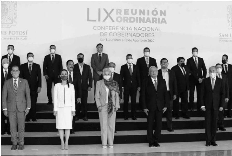
Imagen 2 Presentación discursiva del presidente Andrés Manuel López Obrador sobre el uso de cubrebocas