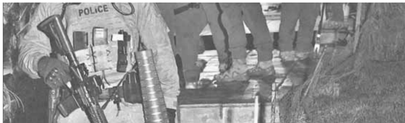
▲ Integrantes de la Agencia para el Control de Drogas (DEA) realizan un cateo y detención de sospechosos de pertenecer al cártel Jalisco Nueva generación en una residencia en Diamond Bar, California. El