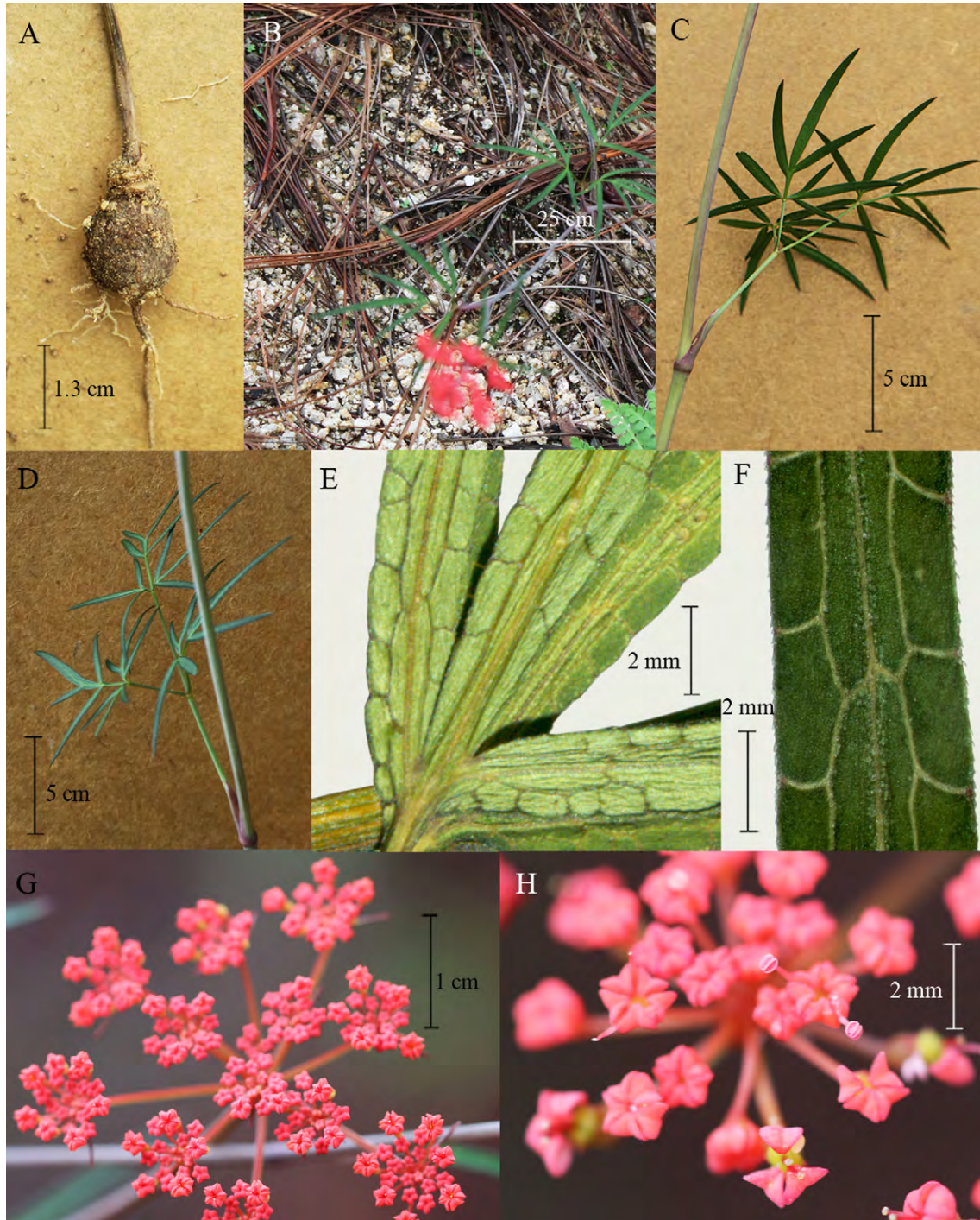
Figura 1. Prionosciadium tamayoi . A, Raíz tuberosa; B, planta completa en floración en la que no se ven hojas basales; C, vista abaxial de una hoja; D, vista adaxial de la hoja; E, base de una pinna ternada por su lado abaxial; F, detalle de una división foliar por su lado adaxial, se observan márgenes enteros; G, vista polar/aérea de una umbela; H, detalle de la vista polar/aérea de un radio.

tubos oleíferos 1-2 en cada espacio intercostal, 4-7 en la cara comisural; semillas elipsoides, dorsalmente comprimidas, acanaladas debajo de los intervalos, involutas.