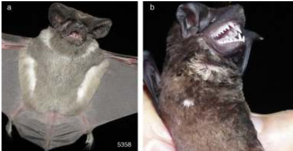
Figura 3. a) Nyctinomops femorosaccus (5358), CF manchas blancas; b) Molossus sinaloae , CF manchas blancas.

contó con 23 individuos de 12 especies; la CF no agouti, con 11 individuos de 7 especies, y la CF descolorido, con 4 individuos de 4 especies; se asignaron 3 individuos de 2 especies con una CF combinada manchas blancas-no agouti, y 2 individuos de 2 especies como CF manchas blancas-descolorido (tabla 1).