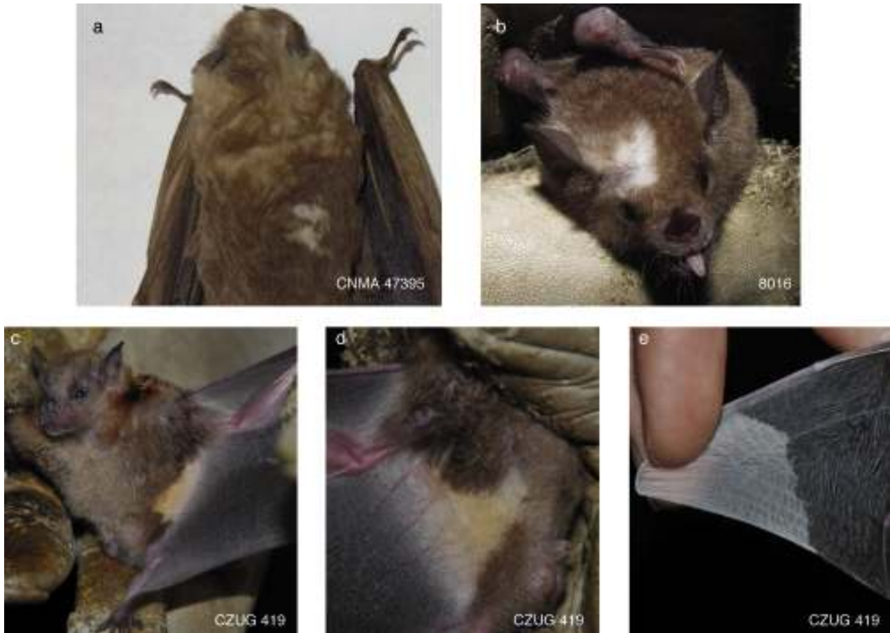
Figura 2. a) Artibeus lituratus (CNMA 47395), CF manchas blancas; b) G. soricina (8016), CF manchas blancas; c-e) Sturnira parvidens (CZUG 419), CF combinada manchas blancas-descolorido, el pelo de los costados de lado ventral es amarillo (c, d) y las puntas de las 2 alas son blancas (e).

Juchitán de Zaragoza, La Venta, 16°36'30.88" N, -94°47'21.70" O, 25 m snm, en selva baja caducifolia, el 21 de abril de 2011 a las 22:15 h. El antebrazo midió 39.2 mm y pesó 19.5 g. Se asignó a una CF combinada manchas blancas-descolorido, porque el pelo de los costados (fig. 2c) del lado ventral (fig. 2d) fue amarillo (CF descolorido), el resto del cuerpo y las membranas alares de color normal, pero las puntas de las 2 alas fueron de color blanco (CF manchas blancas; fig. 2e).