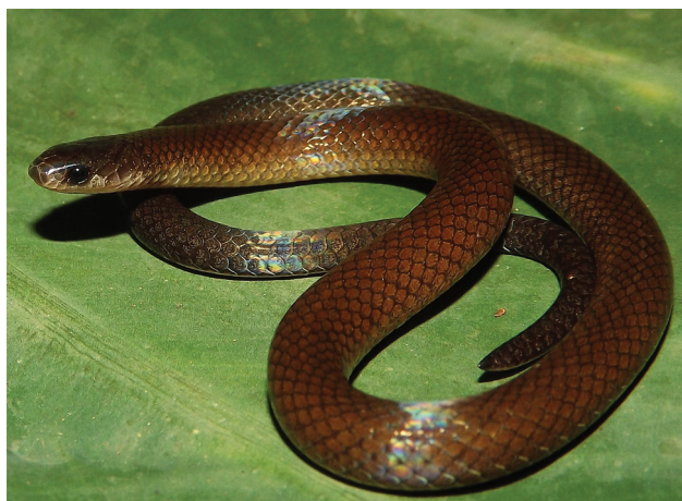
Figura 1. Ejemplar en vida de Tantillita lintoni (CARI-1190) recolectado en la localidad de Arroyo Zarco, Uxpanapa, Veracruz.

94°28'3.4" O, WGS84; 356 m snm) a 4 km del límite con el estado de Oaxaca. Los 3 ejemplares fueron encontrados en microhábitats terrestres, al interior de fragmentos de selva alta perennifolia.