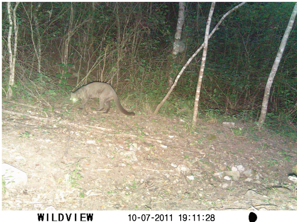
Figura 2. Fotografía de Puma yagouaroundi , tomada en la localidad de San José del Chilar, municipio de Cuicatlán, Oaxaca.

Adicionalmente, se han realizado 3 avistamientos de la especie en la cañada oaxaqueña: el primero de ellos se remonta al 25 de septiembre de 2007, cerca de la población