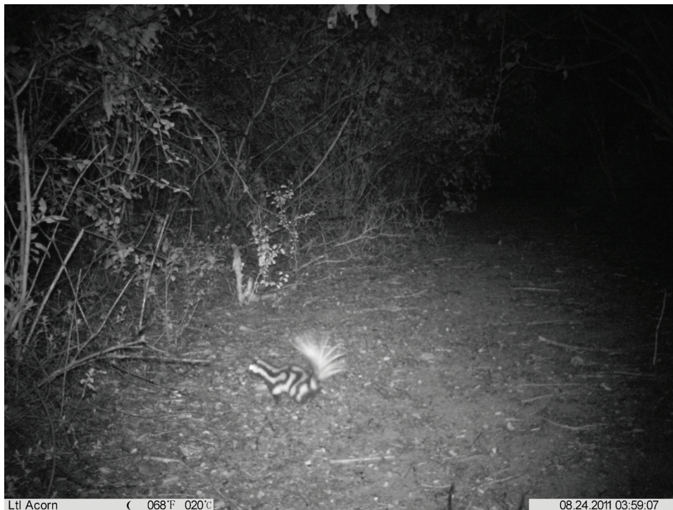
Figura 1. Fotografía de Spilogale angustifrons , tomada en la localidad de San Juan de los Cues, municipio del mismo nombre, Oaxaca.

El 24 de julio del 2011, con un esfuerzo de captura de