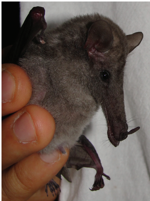
Figura 1. Fotografía de un macho adulto de Musonycteris harrisoni capturado en una cañada a 2 km al SO del poblado El Salado, municipio de Jolalpan, Puebla, México.

El 23 de mayo de 2011, se capturó un individuo de M. harrisoni a 2 km al NO de El Salado, municipio de Jolalpan, Puebla, en la región conocida como la mixteca baja poblana. En una cañada se colocaron 7 redes de niebla (75/2 polyester, 2.6 m de altura, 12 m de ancho, separadas de 10-20 m entre sí). Las redes se abrieron con la puesta del sol y el individuo de M. harrisoni se capturó a las 20:47 h. El murciélago fue un macho con testículos inguinales, antebrazo de 43.4 mm, longitud de oreja de 14.3 mm y 14 g de peso. Las orejas eran redondeadas y pequeñas, el pelaje gris marrón. El hocico muy alargado y distintivo, con longitud de los ojos a la punta del rostro de 18.5 mm. Con base en Medellín et al. (2008), se confirmó la identidad específica del murciélago. Se recolectaron muestras de pelo y tejido, mediante una punción de la