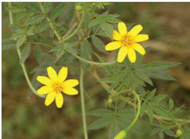
Figura 1. Tagetes lacera Brandegee en floración.