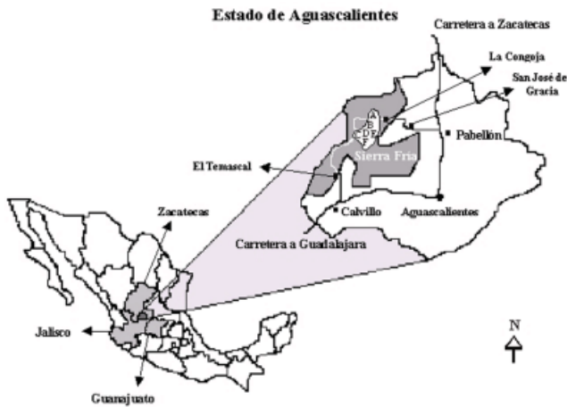
Figura 1. Ubicación del área de estudio y de las localidades donde se encontraron los sitios de percha o dormideros de guajolote silvestre en la Sierra Fría, Aguascalientes. A= Charco Azul; B= Los Alamitos; C= El Empinado; D= El Gauro; E= Cerro Los Juanes y F= El Edén de Los Padilla.

pluviales temporales (INEGI, 1993). Los climas semiseco-semicálido, semiseco-templado y templado-subhúmedo, predominan en la región. La temperatura media anual es de 17°C y la precipitación promedio de 600 mm; enero es el mes más frío y julio el más cálido, mientras que marzo es más seco y julio el más húmedo (Villalobos, 1998). La mayor parte de los suelos son someros y con afloramiento rocoso, de color gris rojizo y gris oscuro, con texturas franco arcillosas y un pH que varía de 6 a 6.6, con algunas zonas bastante ácidas (Villalobos, 1998).