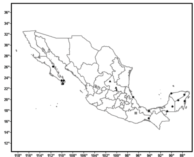
Figura 2. Distribución conocida de Pluchea foetida (cuadros), P. mexicana (triángulos), P. parvifolia (círculos) y P. rosea (asteriscos).

Pluchea odorata (L.) Cass., Dict. Sci. Nat. 42: 3. 1826.