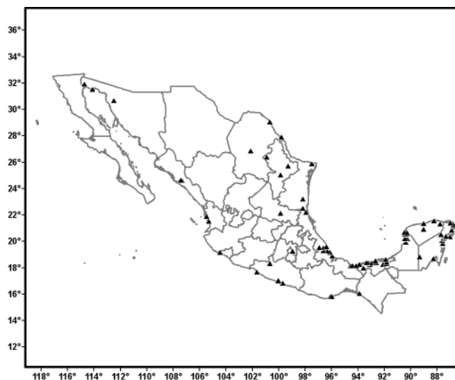
Figura 3. Distribución conocida de Pluchea odorata .

Distribución en México (Fig. 3): Campeche: Cabrera 13995 (MEXU), Chan 4915 (MEXU), Flores 9764 (MEXU), Góngora 543 (MEXU), Martínez 27964 (MEXU), Matuda 3859 (MEXU), Ocaña 216 (MEXU), Zamora 5114 (MEXU, UCAM); Chiapas: Matuda 16278 (MEXU); Coahuila: Carranza 3476 (IEB), Villarreal 3198 (ANSM, MEXU); Colima: Díaz 3305 (GUADA), Gregory 314 (MEXU); Guerrero: Boege 822 (MEXU), Castillo 6569 (MEXU), Fonseca 146 (MEXU), Freeland 213 (MEXU), Ojeda 73 (MEXU); Nayarit: González 5538 (MEXU), King 3697 (MEXU, TEX); Nuevo León: Bye 28333 (MEXU), Carranza 2638 (MEXU), Sánchez 420 (MEXU); Oaxaca: Castillo 9749 (MEXU), Elorsa 4255 (MEXU), Illescas 4 (MEXU); Quintana Roo: Boege 3255 (MEXU), Cabrera