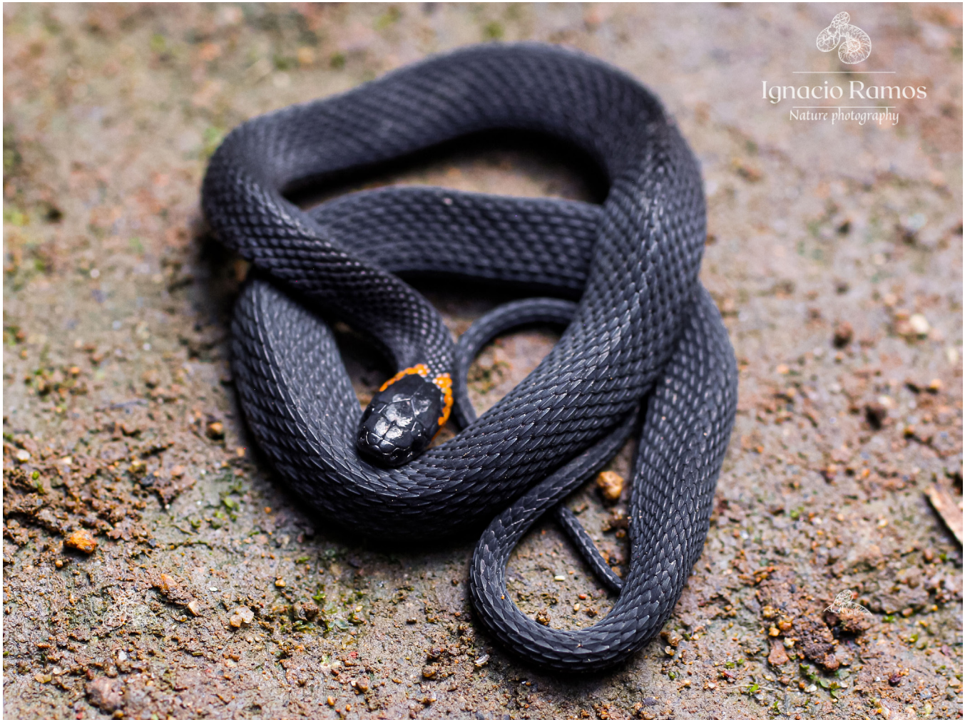
Figure 2. Ninia diademata recorded in a coffee plantation at an altitude of 1,255 m a.s.l. in Huitzilán de Serdán, Puebla.