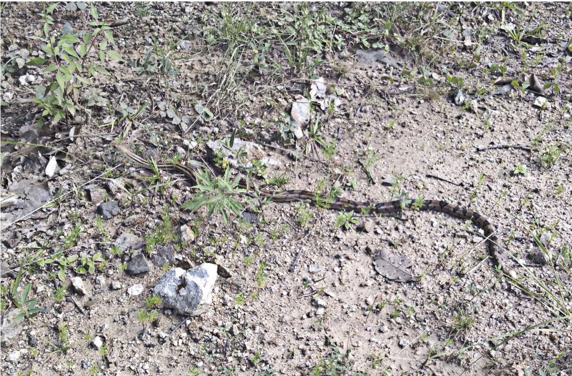
Figure 1. Specimen of Pituophis lineaticollis from the locality of Río Hondo, Municipality of Santa María Peñoles, Oaxaca (UTADC 9745).

Coronel et al., 2021). El váucher fotográfico fue depositado en la colección digital de la Universidad de Texas en Arlington (UTADC 9745). La identidad de la especie fue verificada por Ricardo Palacios Aguilar. La especie se distribuye desde el centro de México hasta Guatemala (Heimes, 2016). En el estado de Oaxaca, P. lineaticollis ha sido registrada en cinco subprovincias fisiográficas (Mata-Silva et al., 2021): Fosa de Tehuacán, Montañas y Valles del Occidente, Sierra Madre de Oaxaca, Sierra Madre del Sur y Valles Centrales de Oaxaca. En el mismo estado, la especie puede ser encontrada en diferentes hábitats