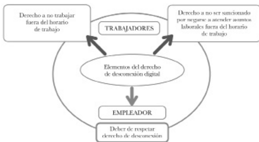
FIGURA 1. ELEMENTOS DEL DERECHO DE DESCONEXIÓN DIGITAL SEGÚN EL CÓDIGO DE BUENAS PRÁCTICAS SOBRE EL DERECHO A LA DESCONEXIÓN

A continuación, en la figura 1 se presenta lo que el Código denomina elementos de la desconexión digital, que son dos derechos que se complementan y garantizan la desconexión a los trabajadores y un deber ineludible de los empleadores.