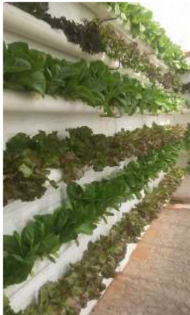
Figura 4. Primera cosecha invernadero automatizado