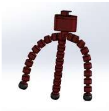
Figura 2. Trip Cam 360°, versión 1

A continuación, se muestran imágenes de los prototipos desarrollados hasta el momento en el proyecto del semillero de investigación.