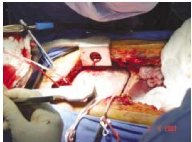
Figura 1. Vista lateral de la toracolaparotomía realizada en una donación multiorgánica. Al extremo izquierdo de la figura se observa una cinta de lino que rodea la aorta ascendente, en la parte media de la imagen, el diafragma y a su derecha el hígado y asas intestinales.

El abordaje se efectúa mediante toracolaparotomía media con esternotomía longitudinal (Figura 1). Se realiza la apertura del pericardio, se efectúa la revisión macroscópica y por palpación (evaluación terciaria), para determinar que el corazón sea apto para trasplante. Una vez determinado lo anterior, se colocan suturas circulares con monofilamento de polipropileno 4-0 en la raíz aórtica para colocar en su centro la aguja para administración de la solución cardio-