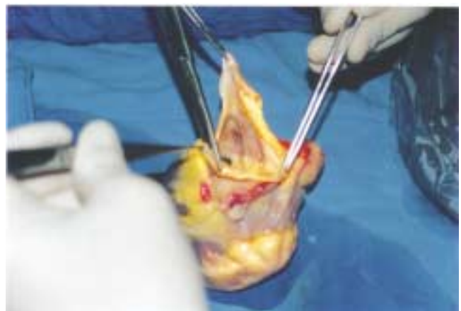
Figura 2. El corazón que se va a implantar se revisa y sus bordes se regularizan de acuerdo con las condiciones de la anatomía del receptor. Se observa tomada con pinzas la pared de la aurícula izquierda.

El corazón que se implantará es extraído del envase en que se trasladó y se modelan los bordes de anastomosis de acuerdo con la estructura del receptor. Es decir, se efectúan los cortes necesarios para que el remanente de la aurícula izquierda del receptor y los bordes de la aurícula izquierda del donador coincidan sin distorsionar la anatomía (Figura 2).