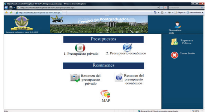
Figura 2. Pantalla de presupuestos y resúmenes. Figure 2. Budget and summary screen.

After registering a window will appear that allows us to capture crops, we must capture the general data of the crop and then start capturing budgets, which are entered by sections, it is necessary to capture the two budgets before referring to the summaries (Figure 2).