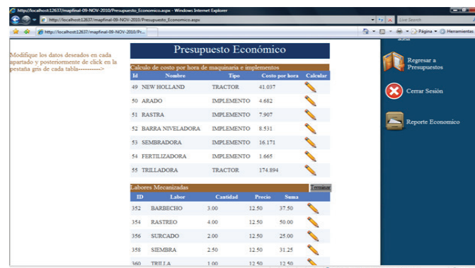
Figura 5. Modo de captura de datos del presupuesto económico. Figure 5. Mode of data capture of the economic budget.

In the case of the economic budget, its capture mode is different. A table of each type of inputs, previously captured in the private budget with the name of the input and the quantity of the input, is shown. The user only enters the economic price in the order that the private was captured, as shown in Figure 5.