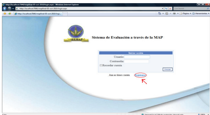
Figura 1. Pantalla de inicio de sesión de SIEMAP. Figure 1. SIEMAP login screen.

La aplicación web desarrollada se denominó sistema de evaluación a través de la MAP (SIEMAP) permitirá a los usuarios registrar información de cultivos agrícolas que se deseen evaluar. La aplicación web inicia con una pantalla de registro de usuario donde se debe introducir nombre de usuario y contraseña a través de cajas de texto, si no se cuenta con esos datos es necesario pulsar registrarse para crear una cuenta (Figura 1).