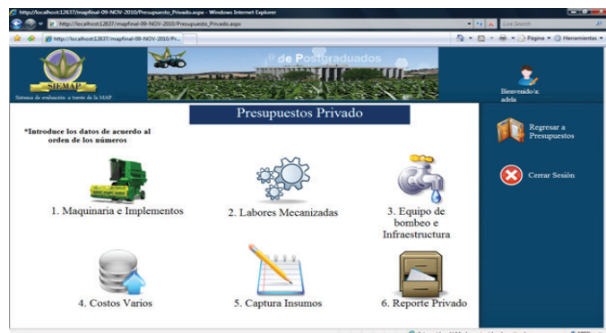
Figura 3. Orden y clasificación de insumos. Figure 3. Order and classification of inputs.

Primero se captura el presupuesto privado ya que si no es así, el presupuesto económico no se mostrará puesto que depende del privado. Para iniciar el presupuesto privado se debe pulsar el botón presupuesto privado y se mostrará la ventana de clasificación de insumos Figura 3. En la figura hay un orden de introducción que es necesario seguir para evitar errores.