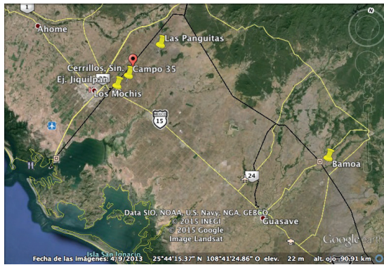
Figura 1. Sitios de muestreo para la identificación de hongos nematófagos de las regiones productoras chile cv Lorca Bell Pepper en el Valle del Fuerte, Sinaloa.