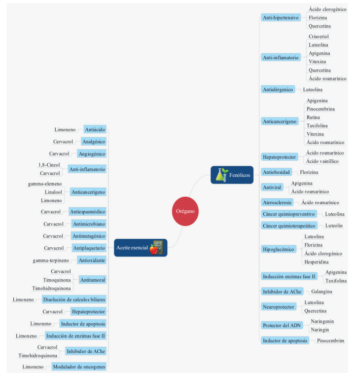
Figura 3. Diagrama de los efectos terapéuticos asociadas a los fitoquímicos presentes en orégano.

Por otro lado, la regulación de la hipertensión puede surgir de la inhibición de la enzima convertidora de angiotensina-I por el extracto de orégano (Mueller et al. , 2008). Estudios adicionales han evaluado la afinidad del extracto de orégano ( O. vulgare ) y algunos de sus componentes sobre receptores activados por proliferadores de peroxisomas (PPARs, por sus siglas en inglés), ya que estos son blanco de varios medicamentos utilizados para tratar el síndrome metabólico como la obesidad, hiperglucemia, hipertensión y dislipidemia. Está establecido que el extracto de orégano contiene antagonistas para el receptor PPAR- \gamma (quercetina, luteolina, ácido rosmarínico y diosmetina), moduladores selectivos del PPAR- \gamma (naringenina y apigenina) y agonistas del PPAR- \gamma (biocanina A) (Mueller et al. , 2008).