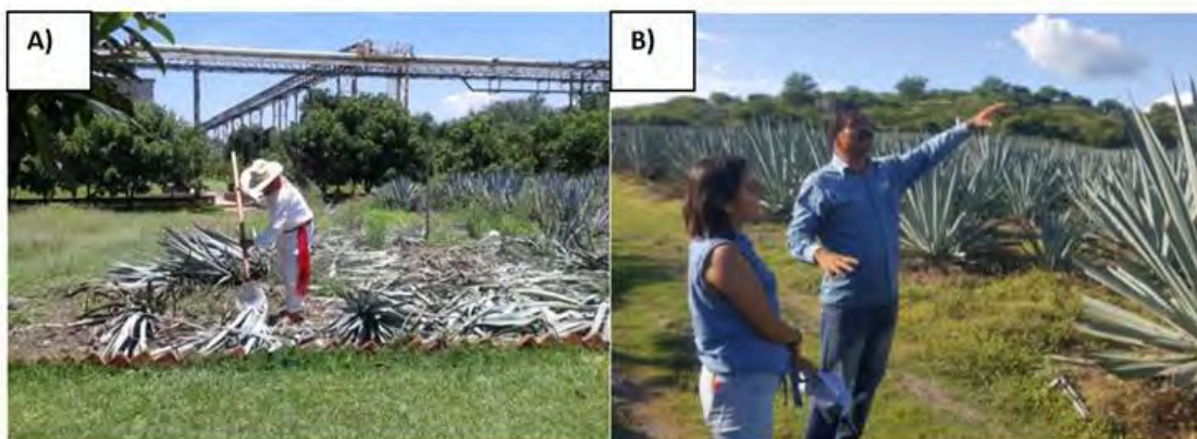
Figura 1. A) paisaje agavero en Arandas, Jalisco; y B) paisaje agavero en Tlaquiltenango, Morelos.

Desde la década de los noventa (durante el boom agavero), una gran cantidad de migrantes llegaron a la ciudad de Arandas en busca de oportunidades de empleo, principalmente en el campo, ya fuera sembrando, manteniendo los plantíos de agave o en la jima de la planta para su posterior traslado a las fábricas (Hernández et al. , 2000). En los alrededores de Arandas, entre milpas e infinitos campos de agave, se pueden descubrir algunas de las haciendas que son parte histórica esencial de la región. Existen en Arandas más de veinte empresas fabricantes afiliadas a la Cámara Nacional de la Industria Tequilera (CNIT), las cuales tienen productos relacionados con la planta del agave y contribuyen al desarrollo de la economía local (CNIT, 2019).