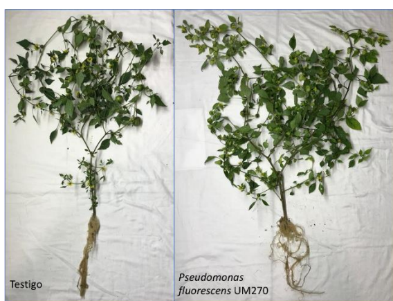
Figura 1. Plantas representativas de tomate de cáscara inoculadas con la cepa UM270 de Pseudomonas fluorescens comparadas con el testigo (sin inocular).

En la Figura 1, se muestran plantas representativas sin inocular e inoculadas con la cepa UM270. La prueba estadística muestra diferencias significativas en peso fresco de planta. Los valores para las plantas testigo (sin inocular) fue en promedio de 76.75 g, mientras que para las plantas inoculadas con UM270 alcanzó un promedio de 196.25 g. Estos datos se relacionan con los presentados por Rojas-Solis et al. (2016) para UM270, donde se observan capacidades de promoción de crecimiento en plantas de tomate. Los autores llevaron a cabo estos experimentos en invernadero y en coinoculación con la cepa de Bacillus thuringiensis UM96. Sin embargo, cuando inocularon únicamente la cepa UM270, identificaron mayor peso fresco y seco en las plantas.