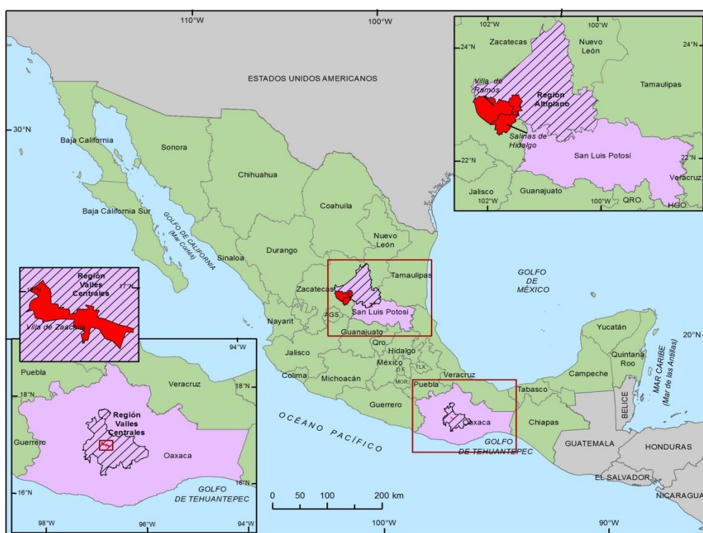
Figura 1. Ubicación de las zonas de recolectas de cultivares de Phaseolus vulgaris L. México.

Las características por las que los productores conservan estos cultivares son: color de la semilla, tiempo corto para la cocción, sabor y consistencia espesa del caldo. En el estado de San Luis Potosí se recolectaron semillas de cultivares claros mejorados, en las comunidades de la Herradura (23° 02' 83" latitud norte y 101° 74' 75" longitud oeste, 2 140 msnm), San Pablo (22° 48' 26" latitud norte y 101° 54' 80" longitud oeste, 2 180 msnm), El Zacatón (23° 43' 61" latitud norte y 102° 20' 9" longitud oeste, 2 024 msnm) en el municipio de Villa de Ramos (23° 02' 83" latitud norte y 101° 74' 75" longitud oeste, 2 140 msnm) y en el municipio de Salinas de Hidalgo (22° 37' 39" latitud norte y 101° 42' 52" longitud oeste, 2 075 msnm) (Figura 1).