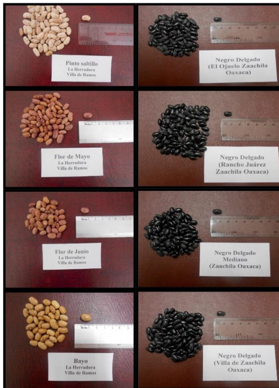
Figura 2. Aspecto general de los cultivares mejorados (claros) y tradicionales (negros) de frijol ( Phaseolus vulgaris L.) evaluados.

Valores en la misma columna con letra diferente son estadísticamente diferentes (Tukey, p \leq 0.05 ).