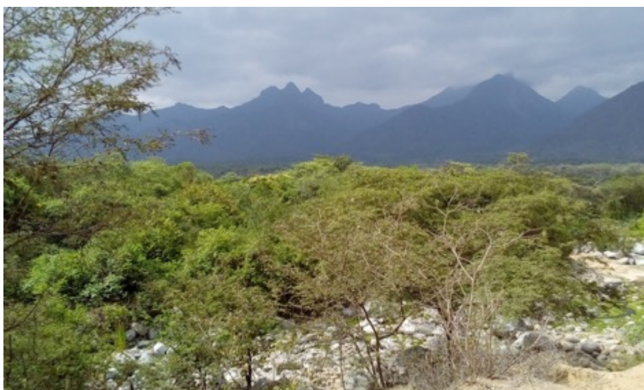
Figura 2. Área de estudio en la que se muestra el Cerro Tres Puntas (Salas-Motupe, Lambayeque, Perú).

El trabajo de campo se llevó a cabo de marzo a junio de 2018 y se utilizó el método propuesto por Gentry (1982; 1995a) para el muestreo de plantas leñosas, con sustanciales modificaciones, debido a la difícil y peligrosa geografía del terreno. Se aplicó un muestreo lineal, cuya línea base fue una trocha (camino estrecho o brecha) relativamente segura que los lugareños utilizan para acceder, ocasionalmente, a la cima del Cerro Tres Puntas (Figura 2).