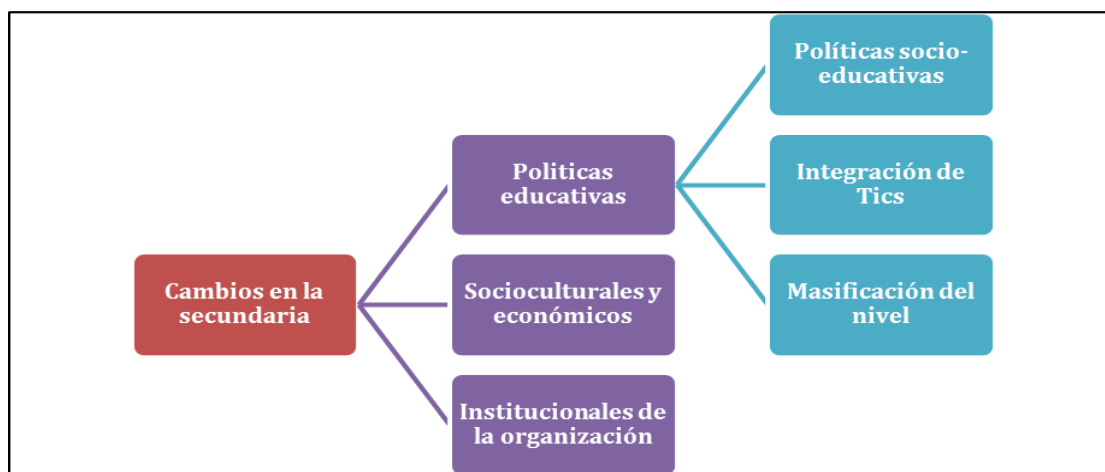
Figura 1. Categorías pregunta abierta: Transformaciones del nivel secundario

Las preguntas abiertas se categorizaron a posteriori , a través de la lectura minuciosa de las respuestas y la realización de sucesivos agrupamientos con la ayuda del Atlas.ti, hasta que se obtuvieron los códigos definitivos (ver figuras 1 y 3). Se consideró la frecuencia en las preguntas de opción múltiple y la cantidad de menciones de las categorías definidas en las abiertas, en este caso se analizó la jerarquía, es decir, los códigos con mayores o menores menciones, cantidad de referencias (citas) en las respuestas vertidas por los profesores.