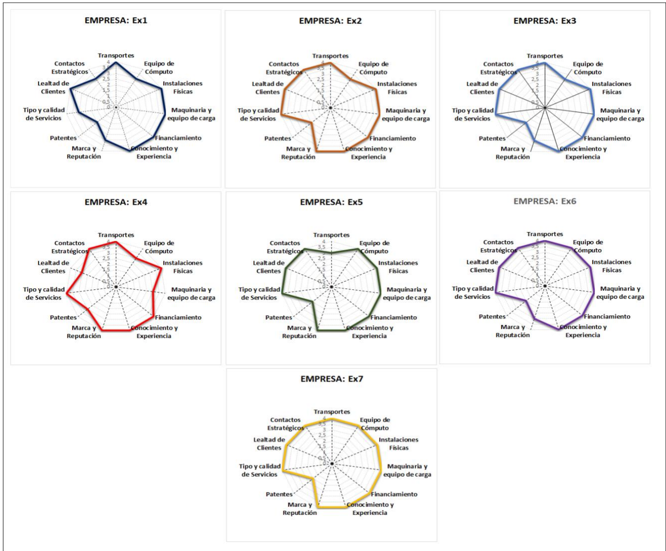
Figura 1. Factores de inversión que incidieron más en la competitividad y productividad.

La figura 1 muestra una convergencia hacia una marcada e intensiva perspectiva de los empresarios examinados acerca de ciertos activos tangibles (AT) que han sido esenciales en su competitividad y productividad considerados disparadores del crecimiento. En este caso, seis de siete examinados indica que las siguientes variables mostraron decisivamente una mayor relevancia: transporte, instalaciones físicas, así como inversión en maquinaria y equipo.