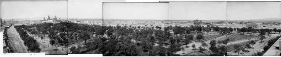
"Panorámica de la Alameda de San Luis Potosí", 2016 (A partir de cinco imágenes de William Henry Jackson de 1891).

Por su parte, William Henry Jackson, además de registrar las imágenes desde la iglesia de San José, también realizó por lo menos otras tres tomas desde el edificio de la estación del Ferrocarril Central, situado al otro lado de la Alameda, en un emplazamiento que algunos denominan como de "contracampo". Es probable que haya pretendido hacer otra "panorámica" con una nueva serie de fotografías, pero al no tener un resultado tan espectacular como el de la imagen 6, solo hizo algunas para mostrar desde otro encuadre parte de la ciudad de San Luis Potosí.