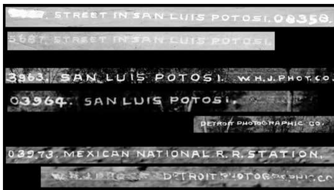
IMAGEN 5. DETALLES QUE MUESTRAN LAS LEYENDAS CON LAS QUE SE SINGULARIZARON CINCO IMÁGENES DE WILLIAM HENRY JACKSON.

Es decir, la toma fotográfica de muchos de estos documentos se puede datar con el año 1891. A partir de esos negativos se manufacturaron copias positivas, algunas