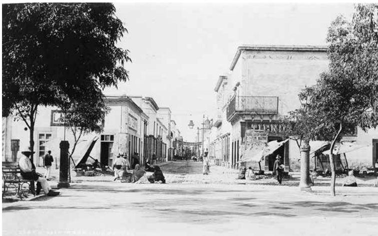
“5687. Street in San Luis Potosí”, 1891. Fototeca Nacional/ SINAFO / INAH, 429081.

Al analizar las fechas y los lugares en los que el mago estuvo en México, se podría lanzar la hipótesis de que las fotografías de la ciudad de San Luis en las que aparece la propaganda del mago las tomó Jackson entre marzo y septiembre de 1891. 13 Es necesario otro tipo de análisis, incluso de las huellas indiciales, para comprobar cuáles de ese grupo de 32 fotografías fueron realizadas en la misma jornada y cuáles, si fuera el caso, corresponden a los viajes anteriores.