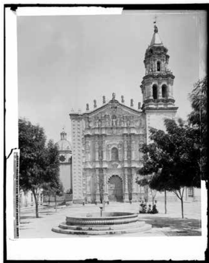
“3969. Church of Carmen, San Luis Potosi, Mexico”, 1891.

Library of Congress, Prints and Photographs Division, colección Detroit Publishing Company, 4a03737.