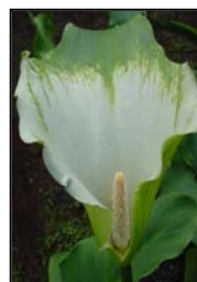
Etapa 6. Espata completamente abierta y espádice con polen.