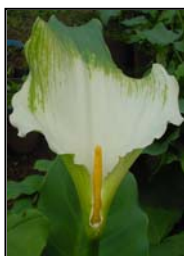
Etapa 5. Espata completamente abierta y espádice sin polen.