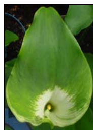
Etapa 4. Espata abriendo y espádice visible.