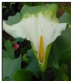
Etapa 7. Espata completamente abierta y el polen del espádice liberado.