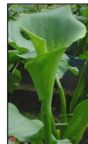
Etapa 3. La espata comienza su apertura.