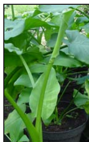
Etapa 2. Espata cerrada y cubriendo el espádice, pedúnculo visible.