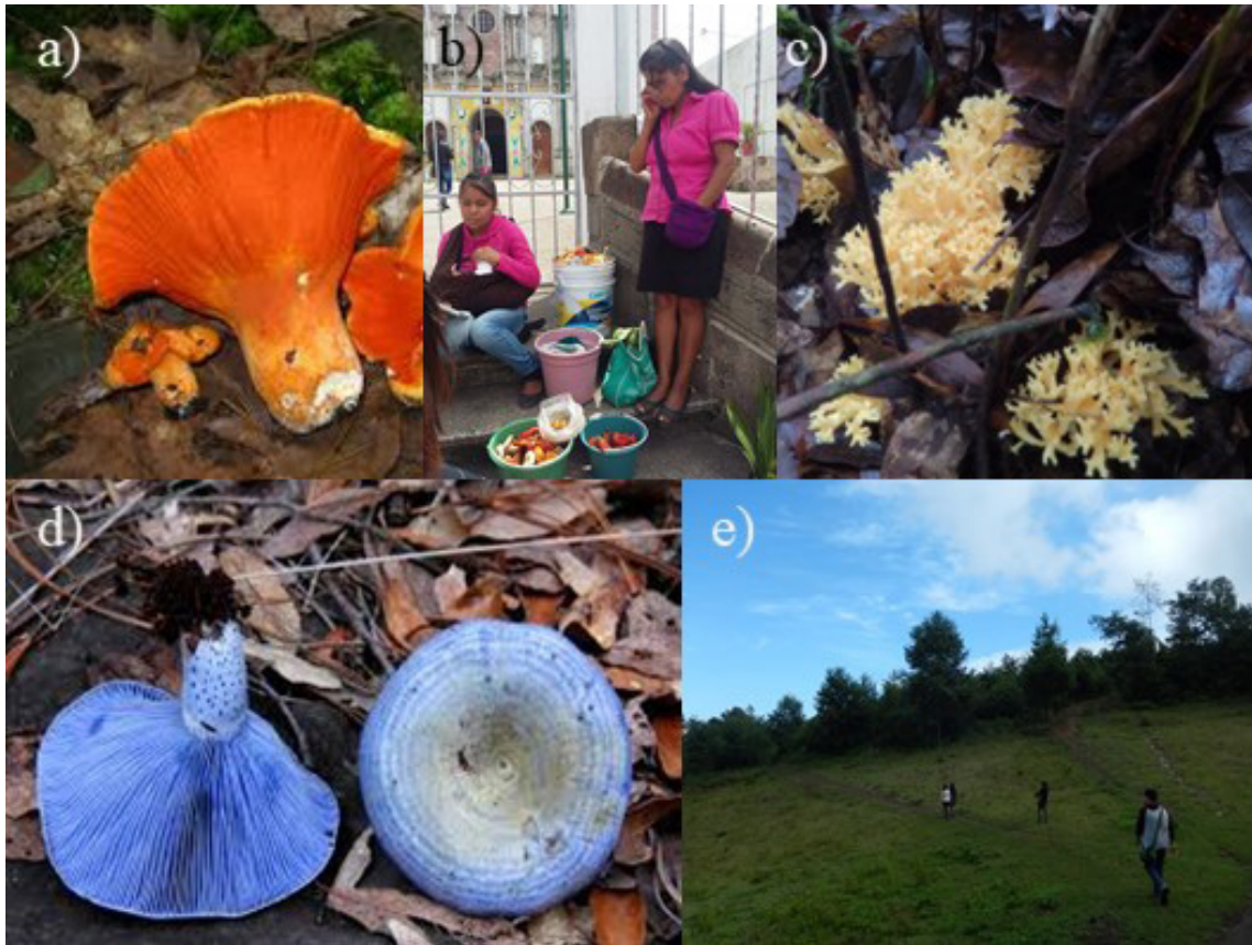
Figure 1. Mushroom species collected in the community La Loma, municipality of Zacapoaxtla, Puebla, Mexico: a) Hypomyces lactiflorum , b) traditional mushroom collectors, c) Ramaria flava , d) Lactarius indigo and e) collection area.