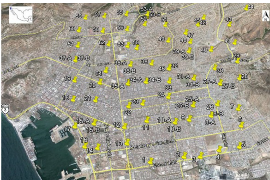
Figure 1. Localization of the urban dust sampling sites in the city of Ensenada, Baja California.

La ciudad de Ensenada, Baja California, México, se localiza sobre la planicie costera principalmente, aunque también ocupa el piedemonte y parte de la montaña (Figura 1); es una ciudad con actividad turística y es el paso hacia el sur de la península por la carretera transpeninsular. Las muestras de polvo urbano se recolectaron sobre 1 m 2 de la superficie de las calles (cemento, asfalto o suelo) de la ciudad en 86 sitios localizados geográficamente. El muestreo fue sistemático en rejilla para evaluar los diferentes tipos