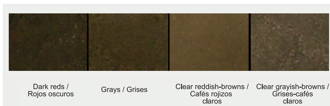
Figure 2. Grouping of urban dust samples (Ensenada, Baja California) with regard to color, based on the Munsell color cards.

Figura 2. Agrupación de muestras de polvo urbano (Ensenada, Baja California) con respecto a su coloración, con base en las cartas de color Munsell.