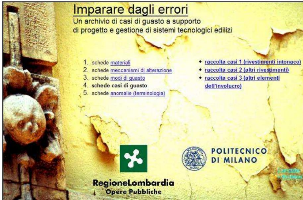
Figura 3. "Aprender con los errores" (BEGroup, 2004)

El Grupo de Estudios de Patología de la Construcción creó un sitio web dedicado a la divulgación de un catálogo de fichas de patología (Freitas et al. 2007). Desde 2004, los usuarios registrados tienen acceso al campo de Patología, donde el esquema de un edificio presenta las fichas de patología de acuerdo con el elemento constructivo (ver figura 4). Al seleccionar el respectivo elemento, es presentada la lista de fichas de patología asociadas. A semejanza de los casos anteriores, estas fichas están estructuradas de la siguiente forma: i) Identificación de la patología; ii) Descripción de la patología; iii) Sondeos y medidas; iv) Causas de la patología; e v) Soluciones posibles de reparación.