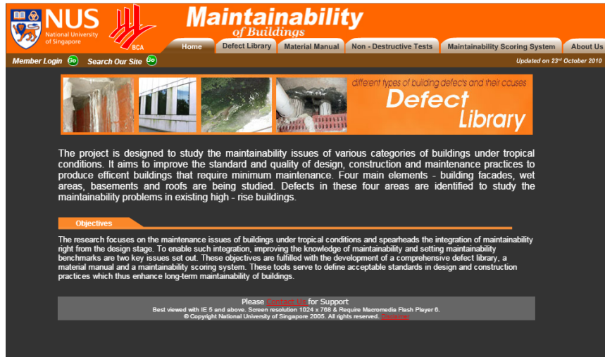
Figura 6. Maintainability website (Chew, 2010)