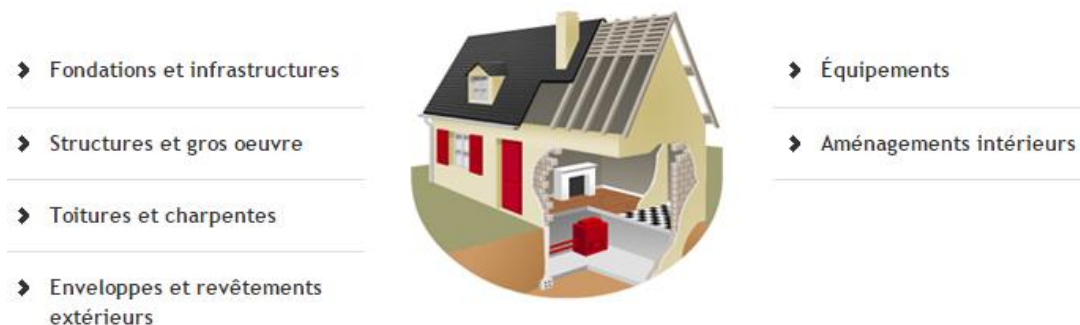
Figura 1. Fiches pathologie du bâtiment (AQC, 2014)

La empresa portuguesa OZ - Diagnóstico, Investigación y Control de Calidad de Estructuras y Fundaciones, Lda. desarrolló un servicio de pre-diagnóstico de anomalías en edificios, llamado Construdoctor (Ribeiro e Cóias, 2003). El servicio surge como un sistema que brinda el diagnóstico on-line , cuyo principal objetivo es auxiliar en la corrección de anomalías en edificios, proporcionando explicaciones básicas sobre las causas probables, haciendo un diagnóstico preliminar y definiendo medidas correctivas. El servicio ofrece un pre-diagnóstico sobre la base de un formulario on-line (ver figura 2). Posterior al sometimiento, las respuestas del entrevistado son evaluadas por especialistas en la patología y rehabilitación de la construcción, que completan un informe on-line con la identificación de la anomalía, especificando las posibles causas y acciones correctivas.