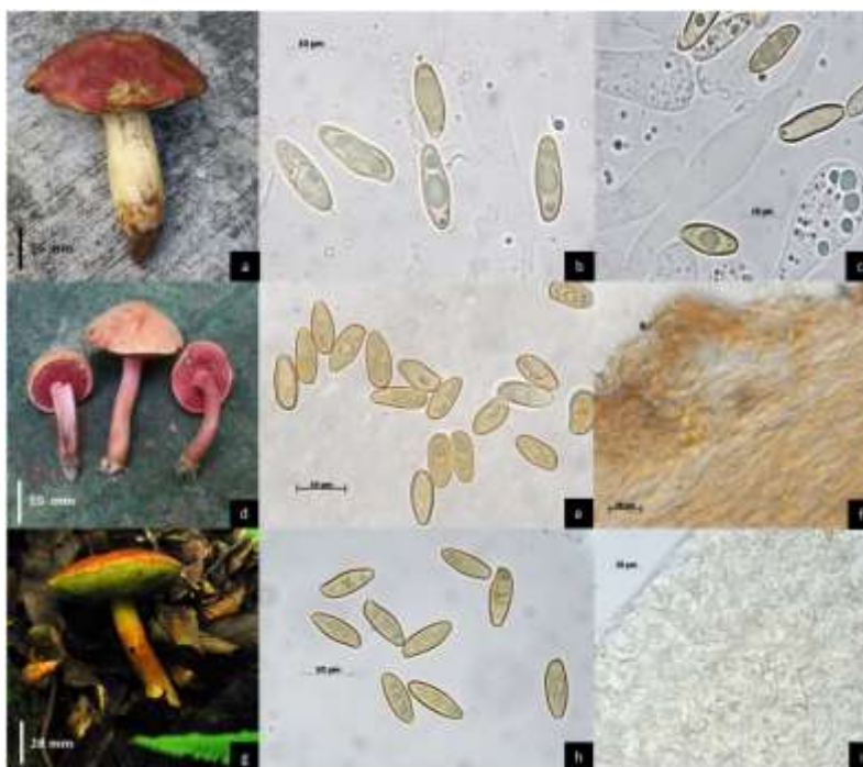
Fig. 2. Boletus speciosus : a) basidioma, b) basidiosporas lisas, c) pleurocistidio fusiforme-ventricoso; Chalciporus rubinellus : d) basidioma, e) basidiosporas lisas, f) estipitipellis con caulocistidios; Hemileccinum subglabripes : g) basidioma, h) basidiosporas lisas, i) pileipellis de tipo epitelio.