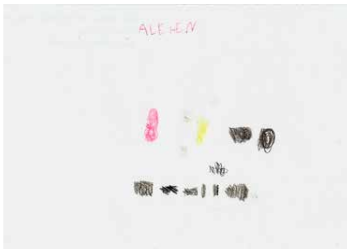
Figura 2. Dibujo de niño de 7 años, primero básico, escuela rural