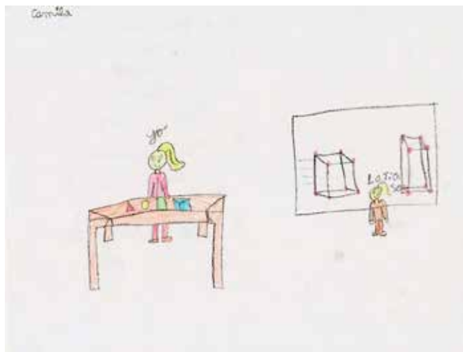
Figura 1. Dibujo de niña de 7 años, primero básico, escuela urbana