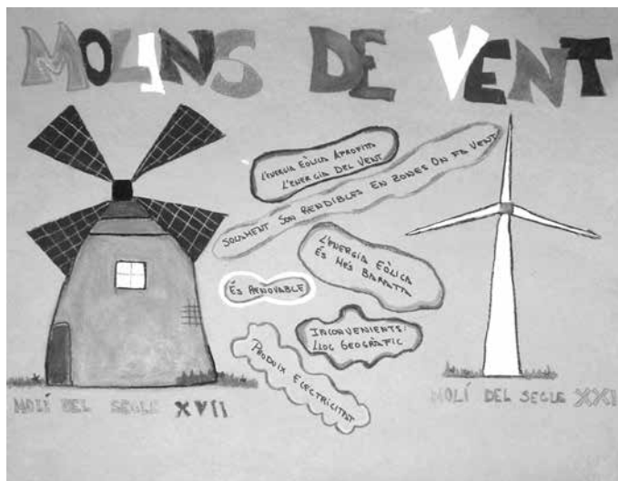
Figura 2. Mural realizado por los/as estudiantes que muestra las ventajas e inconvenientes de un molino de viento y un aerogenerador

La información recopilada se sintetizó en forma de murales que se expusieron en la clase, como el mostrado en la Fig. 2; de esa manera se favoreció el desarrollo de la competencia cultural y artística.