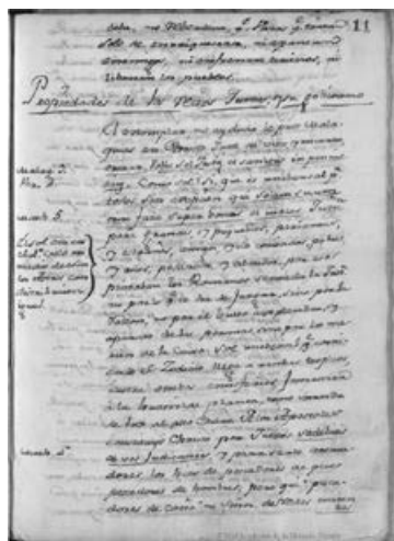
LÁMINA 5. Cuarto y último de los textos identificados por Astrana como las Consideraciones, con el título Propiedades de los rectos jueces y su gobierno (f. 11).