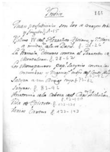
LÁMINA 2. Índice final del volumen de la RAH, que reúne los cuatro textos, ff. 1-15, bajo el título único de Cuán perjudiciales son los de corazón doble y fingido.