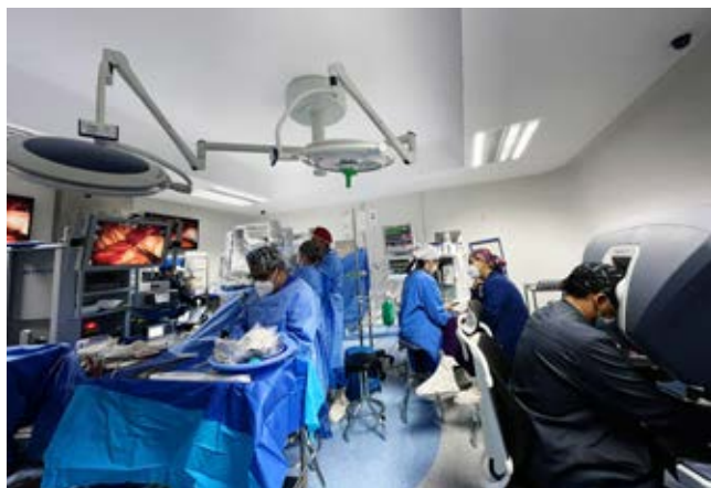
Figura 3: Vista panorámica de un quirófano con plataforma robótica y el equipo involucrado en su operación.