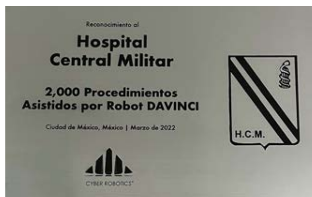
Figura 1: Placa conmemorativa de los 2,000 procedimientos robóticos realizados en el Hospital Central Militar.

Es necesario también entender que el éxito de un programa de cirugía robótica no sólo depende del cirujano; debe considerarse el entrenamiento de todo el personal