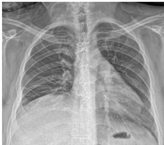
Figura 3: Radiografía de control al egreso del paciente sin evidencia de derrame pleural, sin datos de ensanchamiento mediastinal, con fijación esternal.

Desde los inicios de la cirugía videoasistida en los años 90 y la extensión de su uso en la cirugía torácica se ha contemplado como opción en el tratamiento de la MND. Roberts et al. reportaron por primera vez un caso de drenaje toroscópico como alternativa en un paciente con abscesos mediastinales secundarios a una perforación esofágica. 25 En 2004, Isowa et al. informaron el manejo exitoso de un paciente con MND a través de Video Assisted Thoracoscopic Surgery (VATS). Además, otros dos grupos de autores informaron el uso exitoso de VATS en cuatro y nueve pacientes con MND. Si bien el drenaje toroscópico no ha sido completamente descrito para el manejo de la MND, la exposición toroscópica permite una adecuada visualización del mediastino posterior con un adecuado drenaje de las colecciones; asimismo, se pueden visualizar y drenar colecciones mediastinales. 26-29 El drenaje asistido