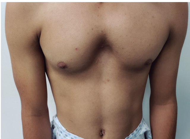
Figura 1: Aspecto clínico característico del pecho arcuato, con protrusión del esternón y de los primeros cartílagos costales.

A través de una incisión media que abarca todo el esternón, los colgajos musculares del pectoral mayor fueron