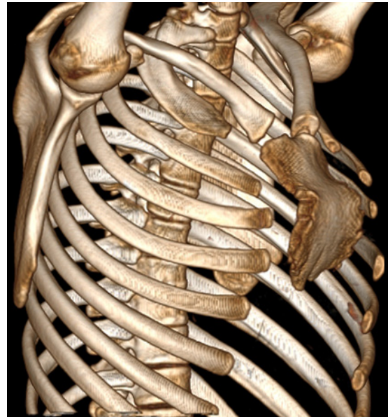
Figura 2: Tomografía simple de tórax que muestra la curvatura anormal en la porción superior del esternón.