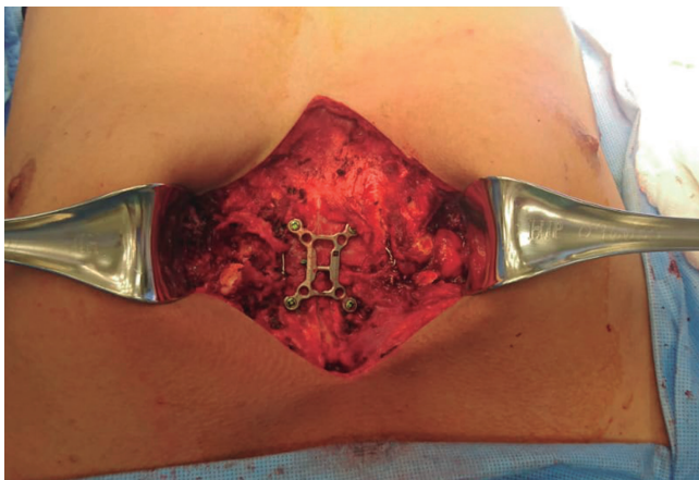
Figura 4: Esternón estabilizado al final de la cirugía con una grapa esternal fijada con cuatro tornillos.

El pecho arcuato, también conocido como síndrome de Currarino-Silverman o pectus carinatum tipo II, es una