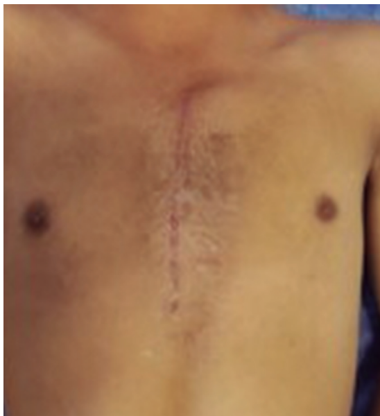
Figura 5: Aspecto posoperatorio un mes después, se aprecia corrección completa de la malformación.